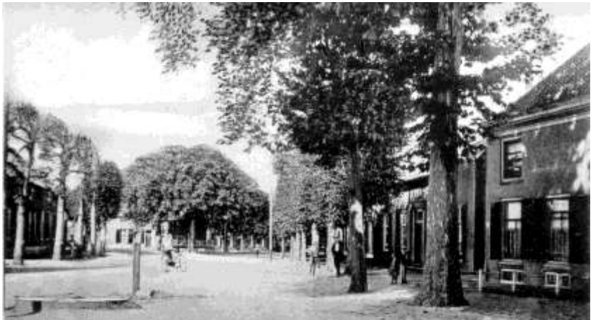
Marktplein van Lienden.