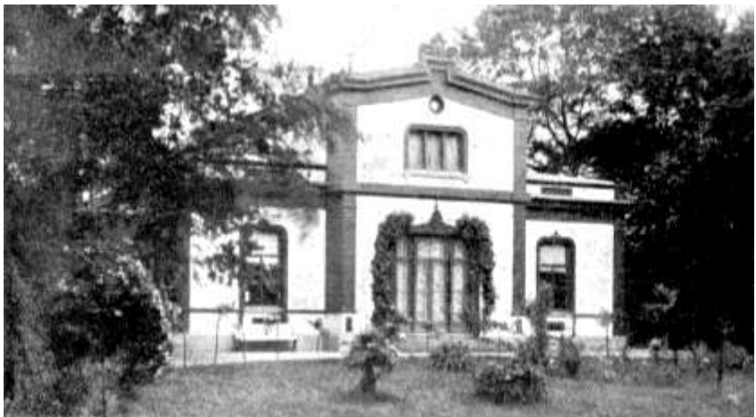
Huize Vredelust van Leccius de Ridder.