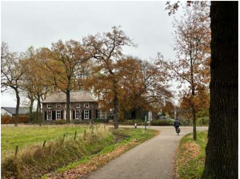
Boerderij de Aschheuvel.