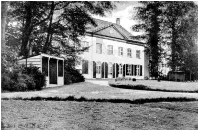
Landhuis Den Eng van vóór WOII.